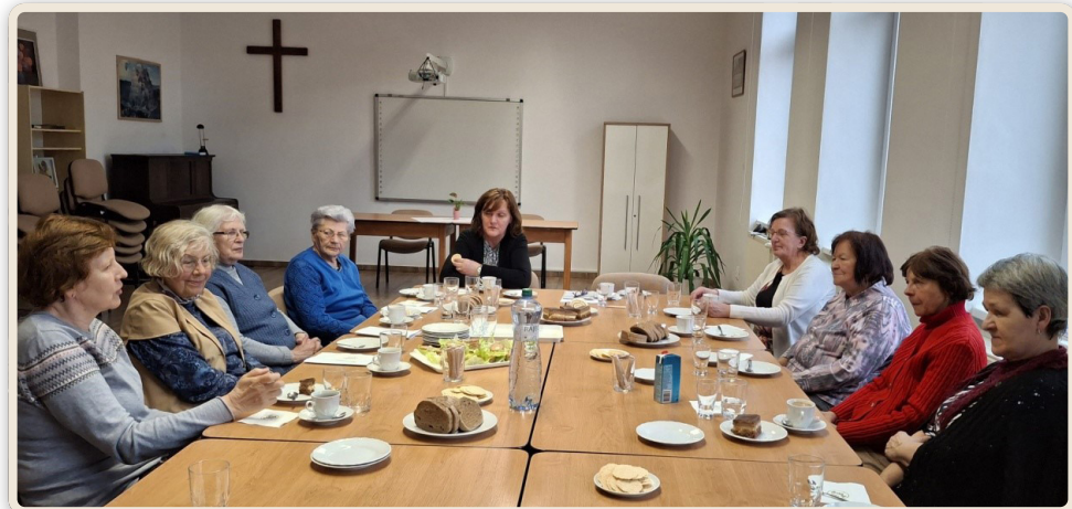
Kaviareň MoS 27/03