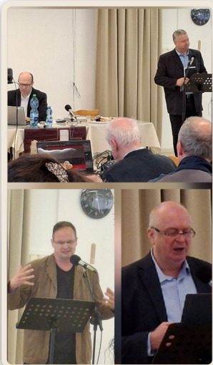
Konferencia MoS ECAV, Košice 14/03