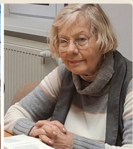
Striedanie účastníčok modlitebnej reťaze 24/01