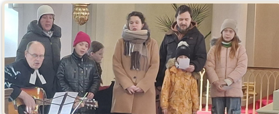
Pieseň mládeže a deti 22/02