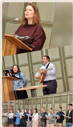
Konferencia Misie na Nile Slovensko, Prešov 07/03