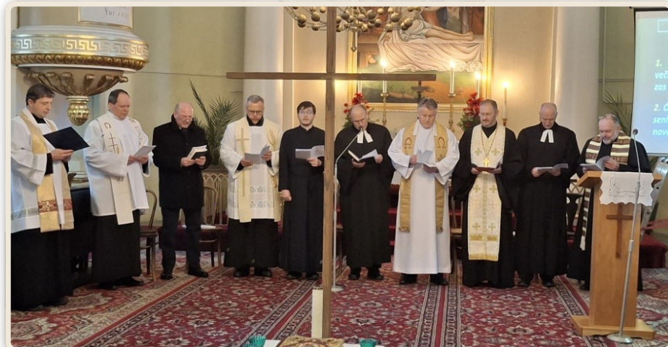
Týždeň modlitieb za jednotu kresťanov 18/01